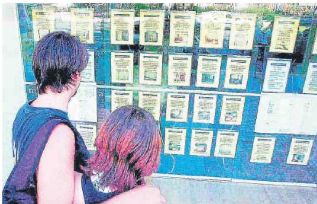
Una pareja de jóvenes, frente al escaparate de una inmobiliaria de la provincia de Cádiz.

Así, la intensidad del descenso en el último año comprendido entre el último semestre de 2010 y el segundo de 2011, alcanza una caída de más de un 25% en la zona denominada en el informe como Cádiz-Playa, que comprende las localidades de Conil, El Puerto y Costa Ballena, en Rota. Sin embargo, en Cádiz-Costa (Chiclana, Chipiona y Rota), el descenso fue de un 10,24%, mientras que en Cádiz capital fue de un 20%.